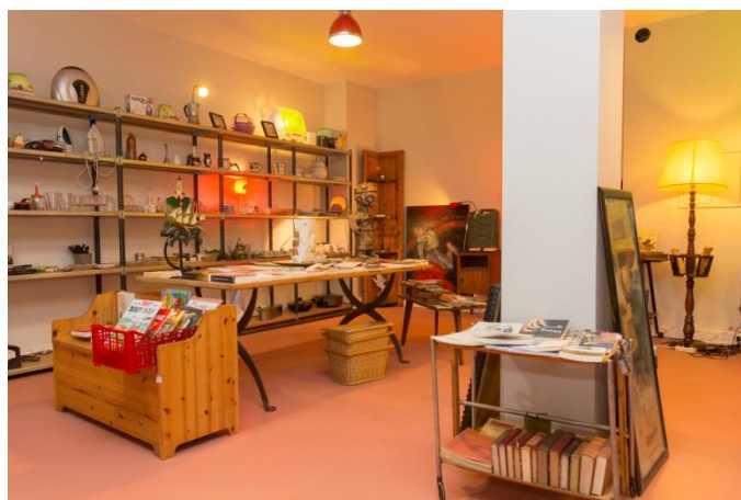
La nouvelle Ressourcerie Paris-Centre, inaugurée en juin 2014