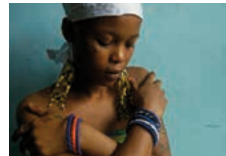
Saïf © Eliane de Latour