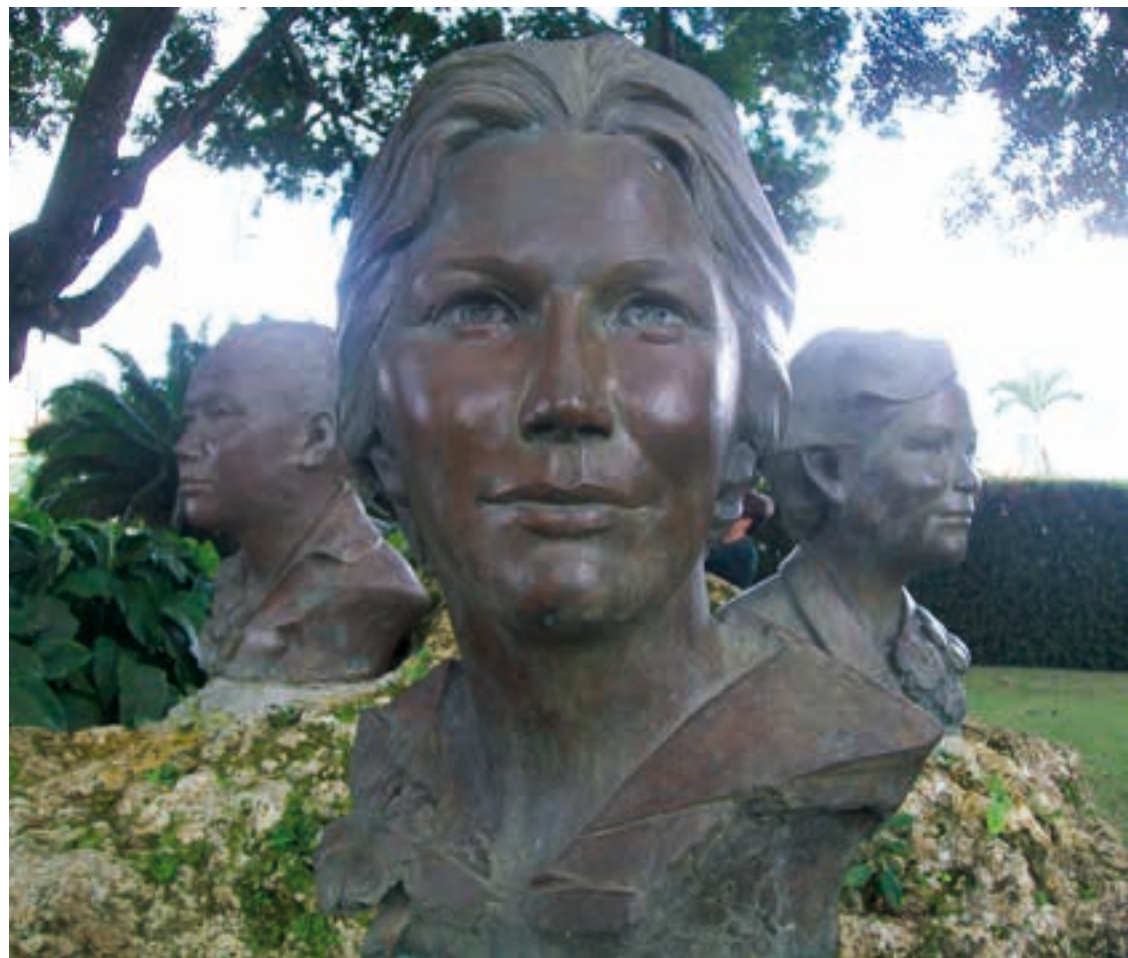
Bustes des trois sœurs Mirabal, Museo de las Hermanas Mirabal (République Dominicaine)

En 1981, les mouvements féministes, réunis à Bogota (Colombie) ont proposé aux Nations-Unies que la date du 25 novembre soit choisie comme "journée internationale pour l'élimination de la violence à l'égard des femmes" en hommage et à la mémoire des trois sœurs Mirabal.