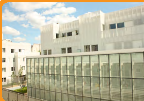
Une crèche et des logements sociaux ont été livrés