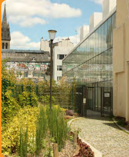
La rue Moufle a été réaménagée